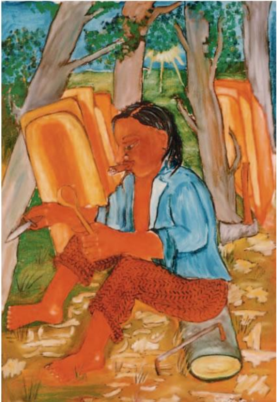
Orsós Teréz: Teknővájó